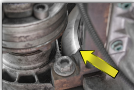
Bild 3: Nach Demontage des Abdeckblechs sind die Unterscheidungsmerkmale sichtbar.

Diese sind in eingebautem Zustand durch ein Sichtfenster in der Getriebeglocke erkennbar (siehe Bild 3).