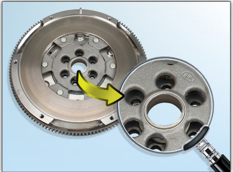
Bild 1: LuK ZMS 415 0059 10 mit Gleitlager

Die oben aufgeführten Fahrzeuge können mit einem LuK- oder Sachs-Zweimassenschwungrad (ZMS) ausgestattet sein. Beide ZMS unterscheiden sich konstruktiv voneinander und können nicht ohne weiteres miteinander verglichen werden.