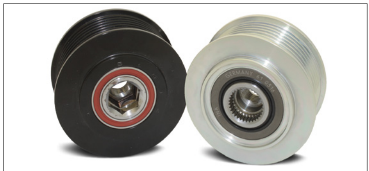
Bild 1: Generatorenfreilauf 535 0214 10

Bei oben genannten Modellen können zwei verschiedene Ausführungen des Generatorenfreilaufes verbaut sein.