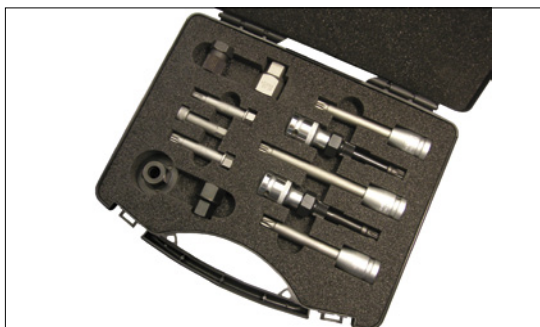
Bild 3: INA-Spezialwerkzeug Artikelnummer 400 0241 10

Zum Aus- und Einbau des Generatorenfreilaufes wird ein Spezialwerkzeug (Bild 3) benötigt.