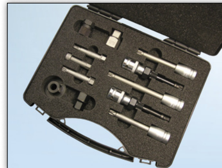
Bild 3: INA-Spezialwerkzeug Artikelnummer 400 0241 10

Zum Aus- und Einbau der Generatorenfreiläufe wird ein Spezialwerkzeug ( Bild 3 ) benötigt.