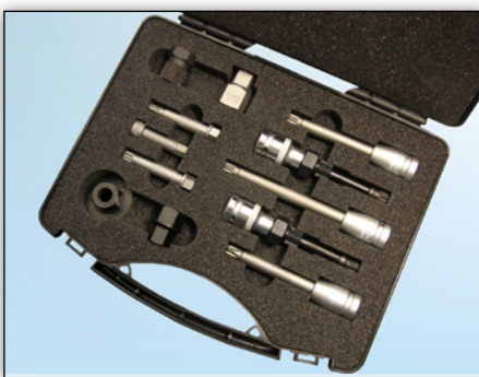
Bild 3: INA-Spezialwerkzeug Artikelnummer 400 0241 10

Beide Generatorenfreiläufe entsprechen uneingeschränkt den technischen Anforderungen und unterscheiden sich lediglich in der Optik.